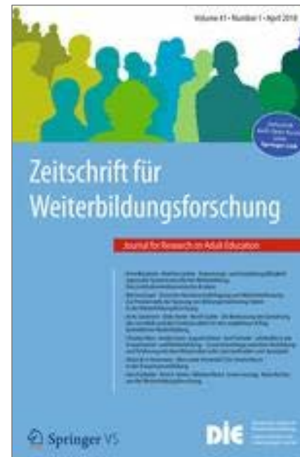
Open Access Zeitschrift seit 2015