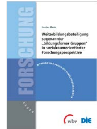
Format 17x24 / PDF