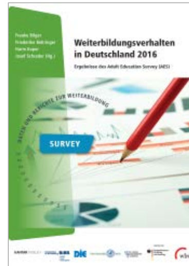
Format A4 / PDF