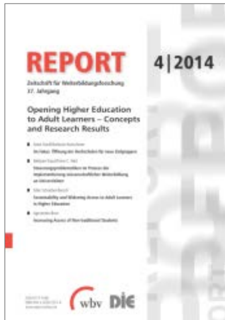
Subskriptionszeitschrift bis 2014