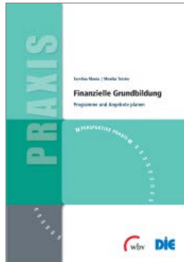
Format A4 / PDF